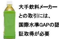
大手飲料メーカーとの取引には、国際水準GAPの認証取得が必要