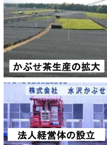
かぶせ茶生産の拡大