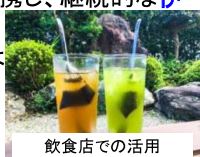
飲食店での活用(伊勢茶ハイ)

・飲食店や観光事業者等との連携による、飲用としての伊勢茶の提供や、伊勢茶を活用した料理、サービスの提供の促進