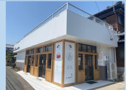
うみべのいえリビング(南伊勢町)