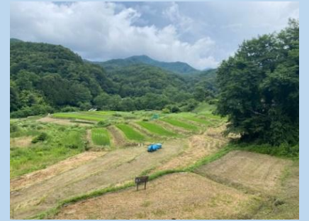
企業の力を活用して再生した棚田(北杜市)