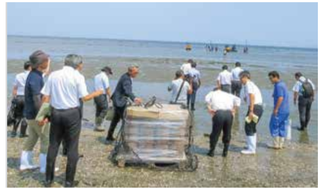
黒ノリの色落ち対策の調査（伊勢市）

これらの調査から得られた知見を生かし、豊かで美しい三重の海が次世代へ引き継がれていくことを目指して、特別委員会として独自の政策提言を取りまとめました。