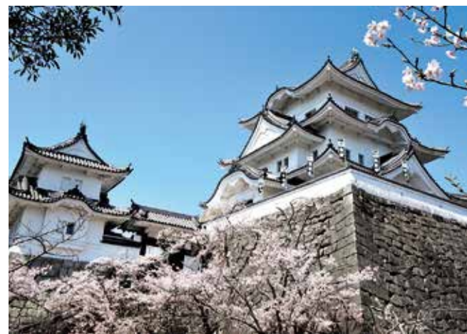
伊賀上野城（伊賀市）