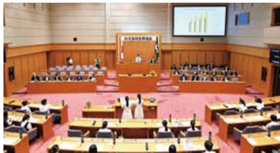
前回（令和6年度）の様子