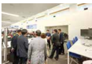
熊本県防災センターを調査（熊本県）

また、過去の災害では災害関連死が多く発生していることから、その対策について改めて重要視し、県当局に対して、災害関連死を防ぐためのきめ細かな対策について要望しました。