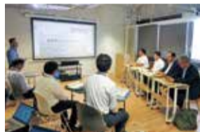
DXの推進について調査（愛媛県）

国内最大級のデジタル実装事業「トライアングルエヒメ」に取り組む愛媛県庁を訪問し、DXの推進に向けた取り組みや、官民共創拠点「トライアングルベース」についての現地調査を行い、その知見を委員会での議論に生かしました。