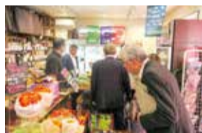
地域密着の直売所を調査（東京都）

また、昨今の農業を取り巻く状況変化等を踏まえて、農産物の生産拡大等の促進、地産地消の推進等が新たに規定された「三重県食を担う農業の振興及び農村の活性化に関する条例案」の審査を行いました。