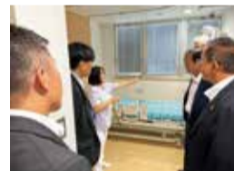
病院における感染症対策の状況について調査（静岡県）

「静岡市立静岡病院」を訪問し、病院における感染症対策の状況や面会制限の問題点等について調査しました。その後の委員会では、調査により得られた知見も生かし、県当局に対して、県民の面会の機会確保の重要性を認識して取り組むよう要望しました。