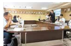
広島市議会での調査（広島県）

全国的に教員不足が深刻化する中、広島市を訪問し、ICTの積極的な導入、教員同士の対話を重視するなどの取り組みにより時間外勤務が減少し、年休の取得日数が増加した小学校の事例について調査を行い、委員会での議論に生かしました。