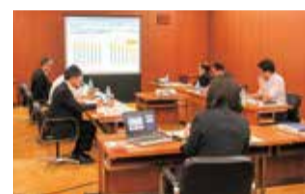
インバウンド誘客について調査（山形県）

大阪・関西万博の開催や第63回神宮式年遷宮等を好機と捉え、本県の認知度向上、観光誘客の取り組みについて調査しました。委員会では、「伊勢志摩観光コンベンション機構」や「山形県庁」を訪問し、インバウンド誘客等の観光戦略について調査し、県当局への取り組みの充実について要望しました。