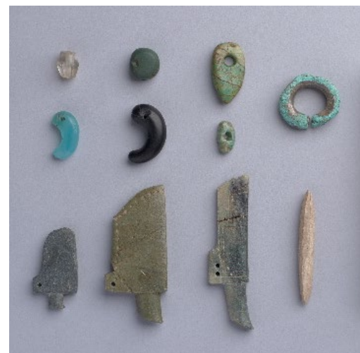
松浦武四郎旧蔵資料 馬角第五 (静嘉堂文庫美術館蔵)