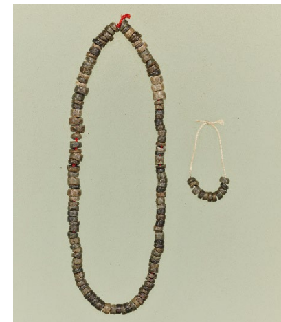
皇大神宮境内出土 白玉 (東京国立博物館蔵) ※