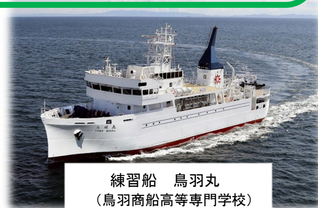
練習船 鳥羽丸 (鳥羽商船高等専門学校)

中部地方整備局、第四管区海上保安本部、中部運輸局、四日市海上保安部、三重県、四日市港管理組合、(独)国立高専機構鳥羽商船高等専門学校、(一社)日本埋立浚渫協会中部支部、中部港湾空港建設協会連合会、(一社)日本海上起重技術協会中部支部、全国浚渫業協会東海支部、(一社)日本潜水協会中部支部、(一社)海洋調査協会、(一社)港湾空港コンサルタンツ協会、(一社)三重県建設業協会四日市支部