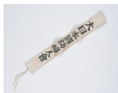
大日本国防婦人会たすき

「三重の実物図鑑人文コーナー」(MieMu 3階)では、三重県総合博物館が所蔵する戦争関連資料のなかから、出征する兵士と、銃後と言われた国民生活の様子がわかる資料を、「戦争と三重」と題し、 7月19日(土)から8月24日(日)まで 展示しています。