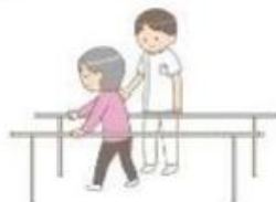
早期の退院に向け、リハビリ、栄養管理等を提供