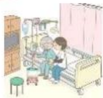
一定の医療資源を投入し、急性期を速やかに離脱