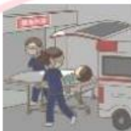
救急患者を受け入れる体制を整備