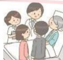
退院に向けた支援 適切な意思決定支援