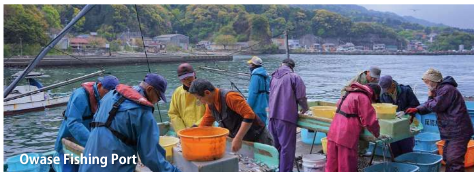
Owase Fishing Port

尾鷲市は黒潮踊る熊野灘が一望できる、リアス式海岸の地形。市内の漁港では約 200 種類もの海の幸が水揚げされます。滅多に出回らない珍味に出会えるかも！