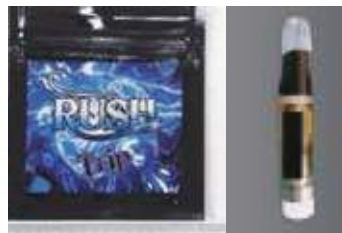
危険ドラッグ(お香、リキッド、グミ、クッキー等)

吐き気、頭痛、精神への悪影響や意識障害などが起きるおそれがあり、麻薬や覚醒剤と同様の危険性が指摘されている。