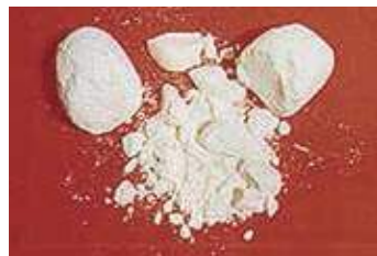
あへん系麻薬(ヘロインなど)

嘔吐や痙攣などの激しい禁断症状がおそろわれ、大量に摂取すると呼吸困難となり、死に至る。