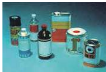
有機溶剤(シンナーなど)

情緒不安定、無気力となり、幻覚や妄想が現れて、薬物精神病になり、大量に摂取すると呼吸困難となり、死に至る。