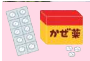
市販薬の過量服薬

吐き気、頭痛、精神への悪影響や意識障害などが起きるおそれがあり、麻薬や覚醒剤と同様の危険性が指摘されている。