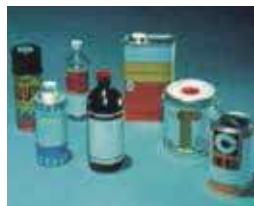
有機溶剤 (シンナー)