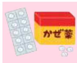
市販薬の過量服薬