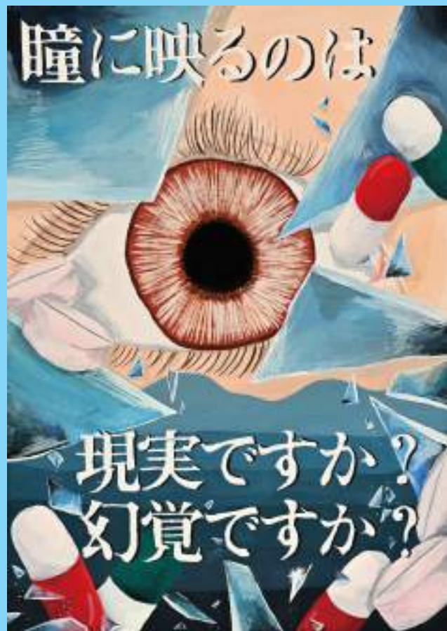
薬物乱用防止ポスター 最優秀作品