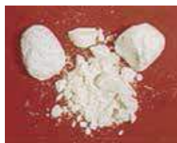
あへん系麻薬 (ヘロインなど)