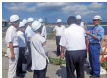
能登半島地震の被災地を調査(石川県)

県外調査で得られた知見を、県が市町と共に行う孤立地域対策や避難所の環境改善等、南海トラフ地震対策の強化のための調査・議論に生かしました。