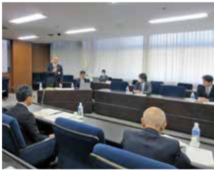
DXShipひろしまについて調査(広島県)

市町DXの促進に力を入れている広島県庁を訪問し、県と市町が協働して行うデジタル人材の確保・育成の取り組み(DXShip(デジシップ)ひろしま)について調査を行い、委員会での議論に生かしました。