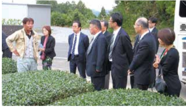
世界農業遺産に認定されている茶草場農法を調査(静岡県)

これらの調査から得られた知見を生かしながら、伊勢茶の振興につながるような実効性のある条例の策定を目指していきます。