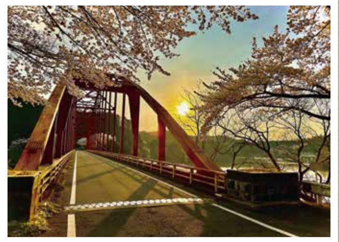
青蓮寺湖 弁天橋 (名張市)