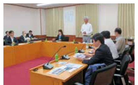
山梨県議会での調査(山梨県)

山梨県は25人学級編制を導入していることから、山梨県議会と山梨県北杜市立長坂小学校を訪問し、その現状や効果について調査を行い、委員会での議論に生かしました。