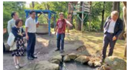
子どもの居場所づくりについて調査(神奈川県)

改正に向けた議論の参考とするため、委員会では神奈川県川崎市にある「子ども夢パーク」を訪問し、「川崎市子どもの権利に関する条例」策定の経験や、不登校・ひきこもりの児童・生徒に求められる居場所づくり等を調査し、調査後の委員会では県当局に対して子どもの権利を守ることを目的とした改正を進めるよう要望し、この意見が改正条例に反映されました。