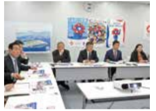
万博に向けた取組状況について調査(大阪府)

委員会では、大阪・関西万博の好機を捉えた、本県の認知度向上、観光誘客の取り組みについて調査しました。2025年日本国際博覧会協会や関西観光本部を訪問し、万博の開催に向けた取り組み状況や万博を契機とした広域観光の推進の取り組み状況について調査を行ったうえで、県当局に戦略的な取り組みの充実について要望しました。