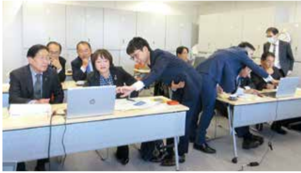
国の行政事業レビューについて調査(東京都)

本委員会は議長を除く議員全員が所属し、部局別に6つの分科会を設け、詳細に審査・調査を行いました。また、正副委員長および理事による県外調査を実施し、近年注目されるエビデンスに基づく政策立案(EBPM)の手法を取り入れた、国の行政事業レビューについて、内閣官房行政改革推進本部事務局において現地調査を行ったほか、長野県庁を訪問し、県民参加型予算の取り組みについて長野県の担当者との意見交換を行い、県の予算審議等に生かしています。