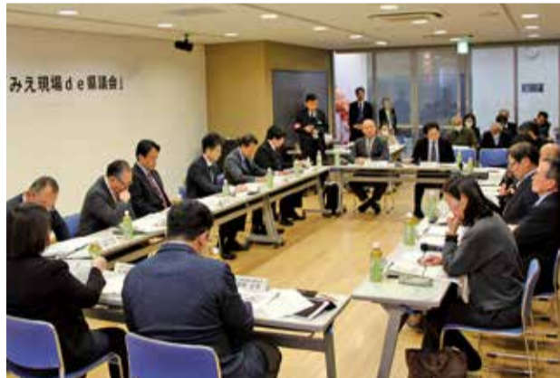
みえ現場 de 県議会