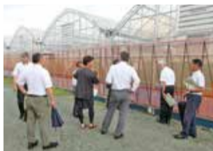
県内の農業生産に関する調査(多気町)

委員会では、食料の安定的な供給と食料自給力の向上に向けて調査を行いました。県で検討が進む「三重県食を担う農業及び農村の活性化に関する条例」の改正およびこの条例に基づく基本計画の見直しに当たっては、県内農業生産の拡大と食料自給率の向上を目指す内容とすることなどを県当局に対して要望しました。