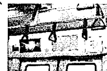
情報発信媒体の例