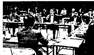
人口減少対策・人材確保に向けた産学官連携懇話会