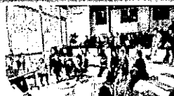
広域連携について考えるワークショップ