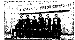
第1回連携プラットフォーム