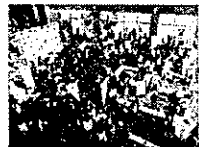
6年度のイベントの様子