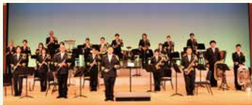
三重県警察音楽隊 安全安心コンサート