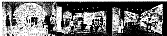
大阪・関西万博 三重県ブース(展示イメージ)

内容：関西パビリオンに三重県ブースを設置し、6つの特集テーマに応じた期間限定の展示を行うほか、会場内2箇所で催事を実施する。