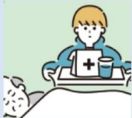
イラスト を取り入れ わかりやす く!

まんせいとき びょうき かぞく 慢性的な病気の家族の かんびょう 看病をしている