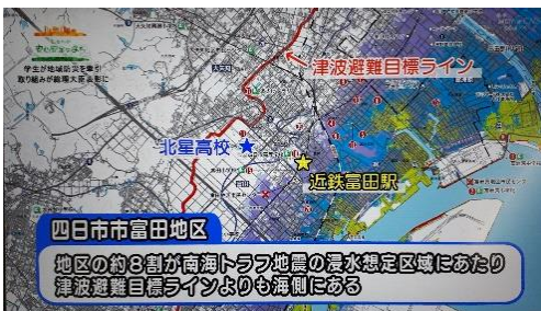
四日市富田地区の現状、ハザードマップから（CTY ニュースから）

令和6年5月には、昨年度までの高齢者、要支援者に加えて、地元の幼稚園児をリアカーに乗せる合同訓練を行ったほか、「命の矢印」の多言語版を作成し、外国人のための防災セミナーで配布するなど、地域貢献を通じて生徒の自己肯定感を高める活動に発展させています。高校生が「率先避難者」として、避難経路沿いにいる高齢者や要支援者に対して声掛けをして避難誘導ができる姿をめざして今後の活動も計画しています。こうした取組は東日本大震災で中学生が避難を呼びかけながら高台に逃げたことで、多くの命が救われた「釜石の奇跡」に続く取組であり、地域の防災リーダー的存在として、「命の矢印」を核とした防災活動と訓練に取り組むことで、地域の「災害文化」の構築に寄与することが大いに期待されます。