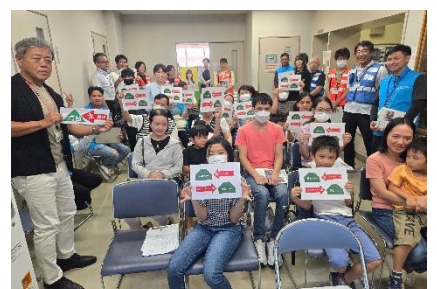
外国人のための防災セミナーでの「命の矢印」多言語版の配布