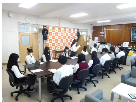
新しい津波避難マニュアルを 校長先生に提案する生徒

これらの取組は、他地域でも参考になるものであり、今後の活動の発展に期待できるものです。