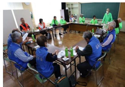
防災授業スタッフ