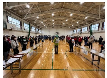
地震・津波実働訓練