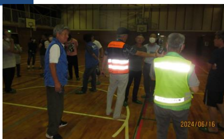
夜間避難所開設訓練