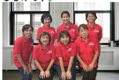
桜ずきんちゃん メンバー紹介

地方紙やケーブルテレビにも積極的にPRし、メディアを通じた効果的な広報活動を展開しています。地域の防災活動への女性の積極的な参画により、性別による固定的な役割分担の意識に捕らわれない姿は、他地域でも参考になるものであり、今後の活動の発展に期待できるものです。