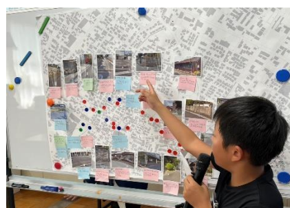
防災サバイバル体験学習 防災マップ発表