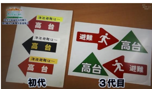
改良を重ね、アニメ化される「命の矢印」