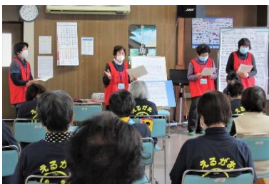
介護予防教室や地域ふれあいサロンでの「防災勉強会」の開催