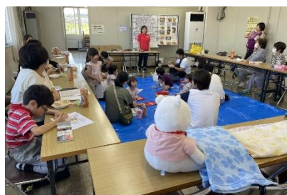
子育て世代対象「おやこ de 防災」