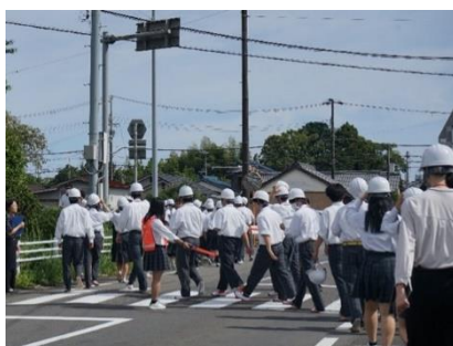
安全を確保するために、 交通整理を実施する生徒