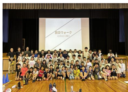
学校との協働：勢和中学校3年生主体の防災ウォーク