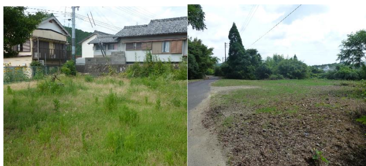
津波避難マニュアルの見直しにあたり、 新たに選定した二次避難場所（2カ所）