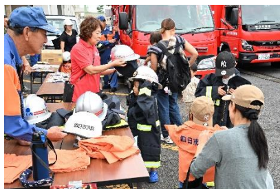
防災運動会「消防服を着てみよう！」