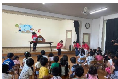
「桜こども園 防災教室」