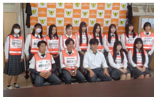
「防災きにゃんプロジェクト+ (プラス)」活動メンバー