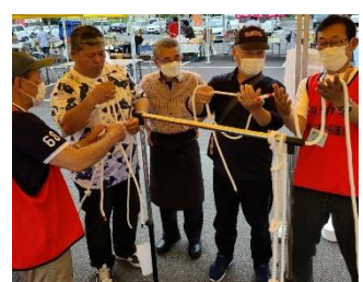
イベントでの「ロープワーク」