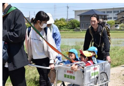
幼稚園児の避難支援による高校生の「自己肯定感」の向上