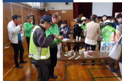
水で作ったカップ麺の試食