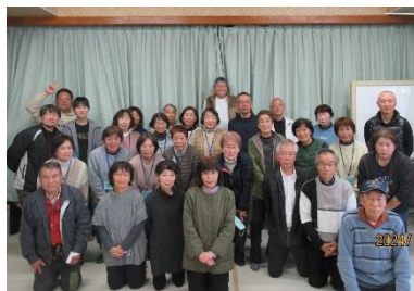
「南伊勢町災害ボランティアコーディネーター連絡会」メンバー

これらの取組は、他地域でも参考になるものであり、今後の活動の発展に期待できるものです。