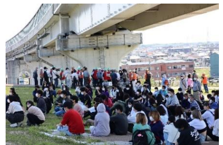
高規格道路近くの高台公園に住民と生徒が集結