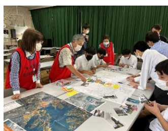
高校生と一緒にタウンウォッチング及び防災マップの作成