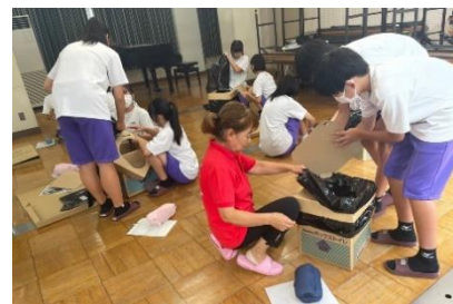
桜中学校 段ボールトイレ組み立て体験