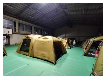
防災サバイバル体験学習 テント宿泊体験