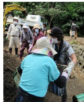
豪雨災害時の支援活動 (土砂の搬出)