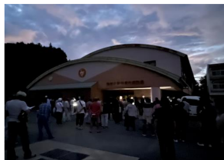
行政との協働：多気町総合防災訓練