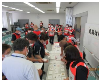
災害ボランティアセンター立ち上げ訓練の様子