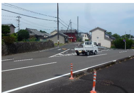
横断歩道設置を目指す、津波避難 ルート上の横断歩道