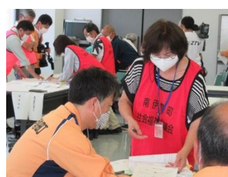
「南伊勢町災害廃棄物初動対応図上訓練」への参加