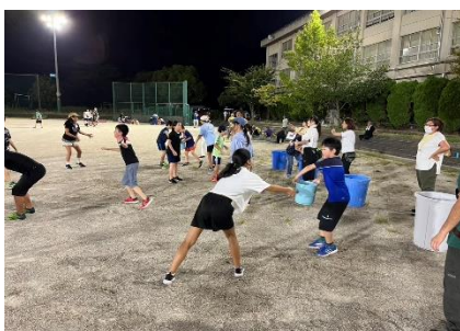
防災サバイバル体験学習 ナイター訓練 バケツリレー