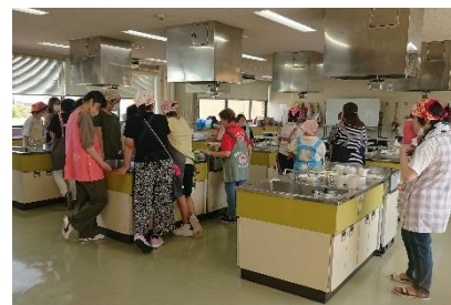
災害弱者支援「四日市市手をつなぐ育成会とパッククッキング」