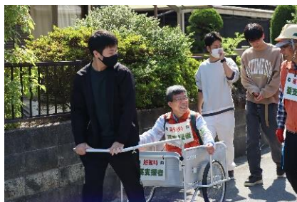
高齢者等要支援者との合同避難訓練の継続実施