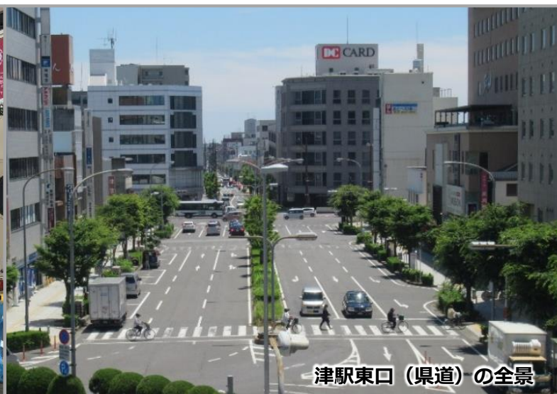
津駅東口（県道）の全景