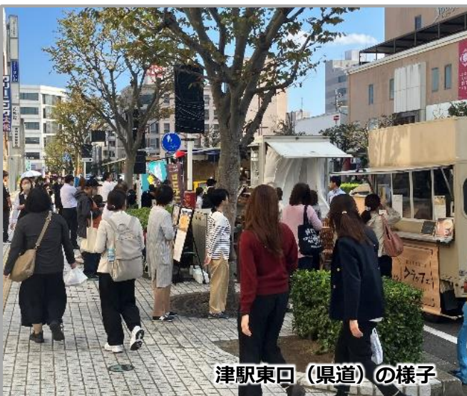
津駅東口（県道）の様子