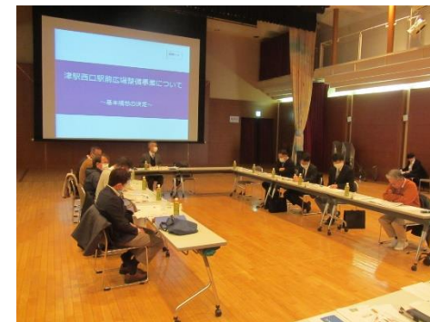
西口エリアマネジメント会議の状況