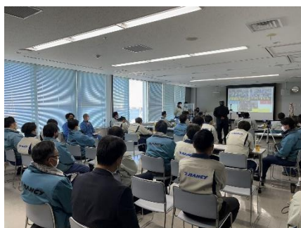
改善提案活動の様子