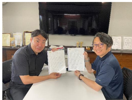
フリーダム社員制度の契約で益々活躍