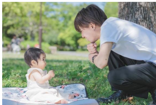
育児休業 公園でリフレッシュ