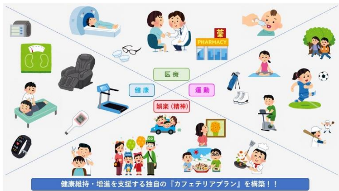
様々なメニューがあるカフェテリアプラン(社内ポスター)