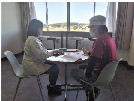
育児休業対象者と個別面談