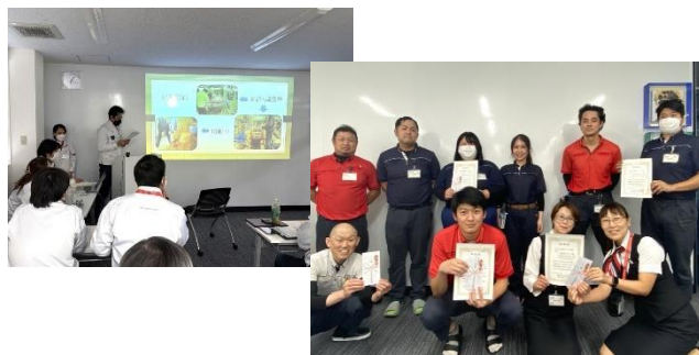
QCサークル活動 発表と表彰