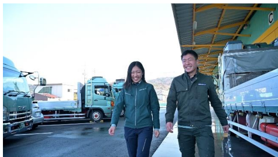
女性も現場で活躍中