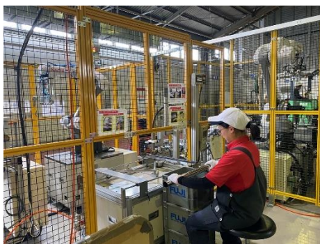
協働ロボット「ローラ製造ロボット」