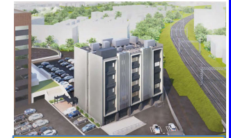
科学捜査研究所完成イメージ