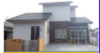
津南警察署 大三駐在所 (令和6年2月完成)

老朽化した交番・駐在所の建替整備、長寿命化に取り組みます。また、令和6年度に引き続き、鳥羽駅前交番の建替整備を進めます。