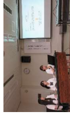
6年度の交流事業の様子