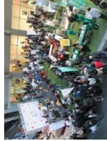
6年度のイベントの様子