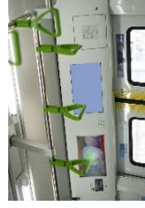
情報発信媒体の例