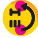
LINE公式アカウント 「三重がまるみえ」