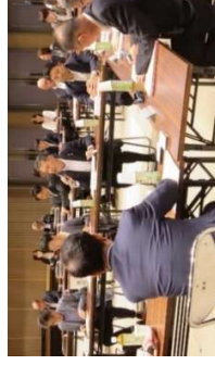
人口減少対策・人材確保に 向けた産学官連携懇話会

(重点・新) 三重で暮らす・働く魅力 の発信事業 10,119千円 人材確保対策課 059-224-3184