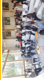
広域連携について考える ワーキングセッション