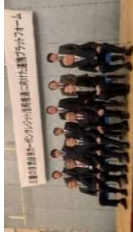
第1回連携プラットフォーム