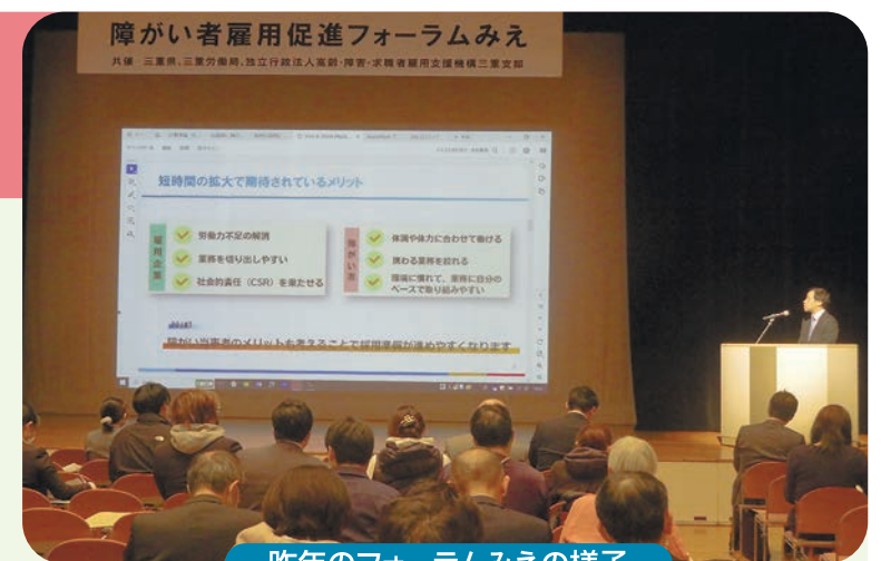
昨年のフォーラムみえの様子