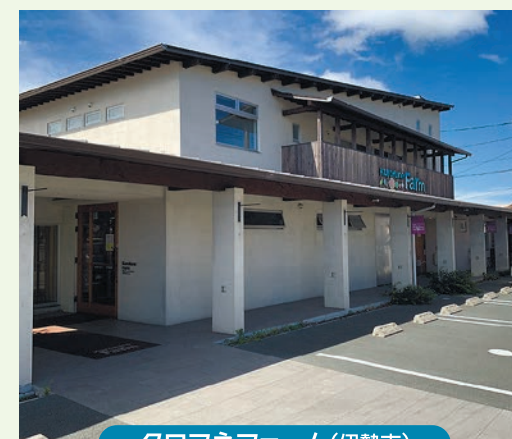
クロフネファーム(伊勢市)

第3部では子ども食堂の企画運営を通じて、企業と共に地域づくりに取り組む障害者就労支援事業所クロフネファーム(伊勢市)の事例を紹介します。地域貢献の視点から働く障がい者について考えてみませんか。