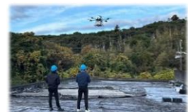
ドローンを使った物資輸送訓練

孤立地域に対し、ヘリコプターで非常用発電機を、また、ドローンで衛星携帯電話を輸送する実践的な訓練を令和6年12月8日に実施。