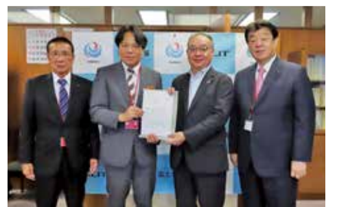
国への要望(国土交通省)

《紀伊半島三県議会交流会議の開催等》 紀伊半島三県議会交流会議で、三県の防災力向上に資する紀伊半島アンカールートの早期整備や、能登半島地震を踏まえた半島地域における防災・減災、国土強靱化等について意見交換し、その着実な推進に向けて協力・連携していくことなどで合意しました。また、三県議会が共同で、紀伊半島アンカールートの早期整備や半島振興法の延長等について国に要望を行いました。