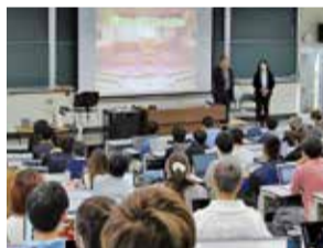
出前講座の様子(三重大学)

《みえ県議会出前講座で学校を訪問》 未来の有権者である子どもたちに、主権者教育の一環として、議会の役割等に関する授業を行っています。10月までに6校で実施し、初となる大学での出前講座も実施しました。学生からは「議会の方々が大変熱意をもって仕事をしていることを知り、感動した。議会の存在をより身近に感じることができた。」などの感想をいただきました。