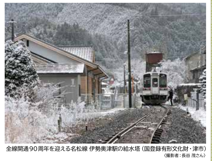
全線開通90周年を迎える名松線 伊勢奥津駅の給水塔 (国登録有形文化財・津市)