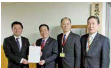
国への要望(農林水産省)

《食料自給総合対策調査特別委員会が提言》 令和5年5月に特別委員会を設置して以降、「食料の安定供給と食料自給力の向上」、「地産地消の取組」、「地場産品の充実」、「食」に関する教育の推進、「農林水産業の後継者・担い手の確保」の5つを重点調査項目に位置づけて、調査を重ねてきました。これを基に、特別委員会としての意見をまとめ、令和6年3月に知事へ提言を行いました。また、国に対しても、食料の安定供給及び食料自給力向上の対応強化を求める意見書を提出しました。知事への提言と国への意見書の提出をあわせて行うのは、特別委員会としては初めてのことです。