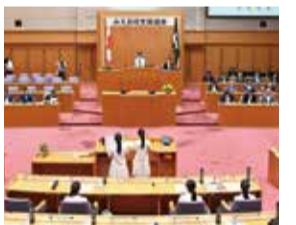
高校生議員による質問

《みえ高校生県議会を開催》 5回目となる「みえ高校生県議会」を開催しました。高校生議員の提案等は、自分たちを取り巻く環境や三重県の状況、他県の事例、統計等を踏まえたものであり、三重県をより暮らしやすくするために大変重要なものばかりでした。議会では、提案等について、9月定例会の行政部門別常任委員会で議論し、参考人を招致して調査を深めたり、委員長報告に盛り込んで知事に要望などを行ったりしました。議会での議論の結果は、今後、高校生にフィードバックしていきます。