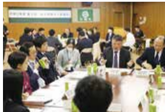
若者との意見交換の様子(令和5年度第2回みえ現場de県議会)

《みえ現場de県議会を実施》 川越町で「若者の人口流出について~若者に選ばれ続ける三重県をめざして~」をテーマに、三重県出身の20歳から37歳までの10名の方と意見交換を行いました。若者の就職・進学に関する考え方や三重県の将来像についてさまざまな意見をいただき、これを県の施策や予算に反映できるよう取り組んでいます。