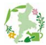
「花とみどりの三重づくり」ロゴマーク

《議員提出条例に基づく「花とみどりの三重づくり基本計画」の議決》 「花や木で健やかな三重をつくる条例策定調査特別委員会」で1年10カ月わたる議論を経て議員提出で成立した「花とみどりの三重づくり条例」に基づく、「花とみどりで優しさあふれる健やかなふるさと三重」の実現をめざし、さまざまな取り組みを進めるための基本計画を議決しました。