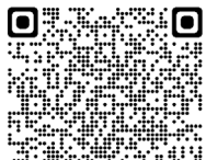
噴火速報について