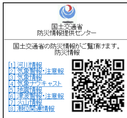
防災情報提供センター 携帯端末向けホームページ (Top)