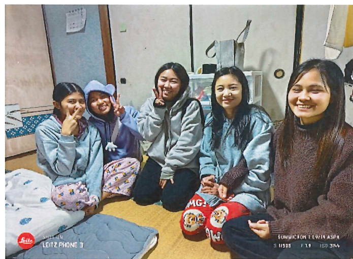
約4ヶ月ぶりの再開 ミャンマーで一緒に勉強した仲間