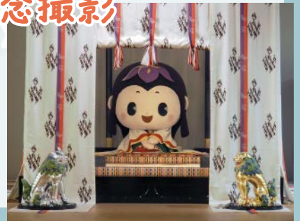
画像はイメージです

対象 平成 16 年 4 月 2 日から平成 17 年 4 月 1 日までに生まれた方