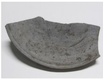
「安」刻書須恵器杯蓋

史跡齋宮跡東部にある方格街区の倉庫群である「寮庫」の区画から、「安」と線刻した須恵器が出土しています。このような「安」刻書須恵器は、伊賀国府跡や他の伊賀市内の遺跡からも出土しており、齋宮と伊賀との関連がうかがえる遺物です。この展示では、この須恵器からみる平安時代初めの齋宮を考えます。