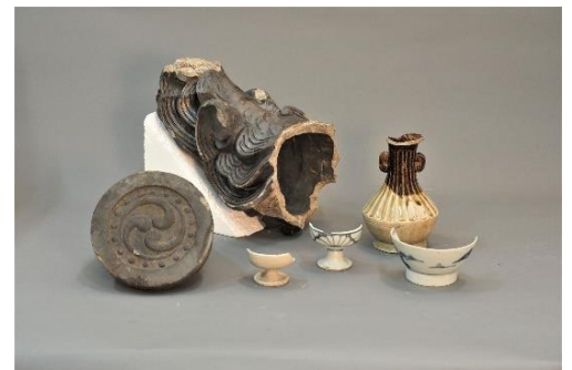
調査で見つかった甃や瓦、近世陶磁器類

令和5年度に、近世の参宮街道沿いで現在の竹神社前の交差点付近で発掘調査を行ったところ、『伊勢参宮名所図会』(寛政9(1797)年)などの史料に「大ほとけ」や「阿弥陀堂」と記された仏堂とみられる遺構や遺物が見つかりました。発掘成果と文献記録が合致する数少ない事例です。近世の参宮街道のすがたが偲ばれる展示です。