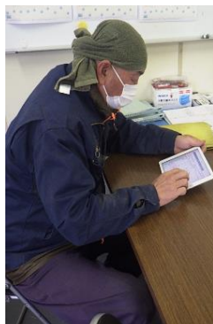
タブレットを積極活用