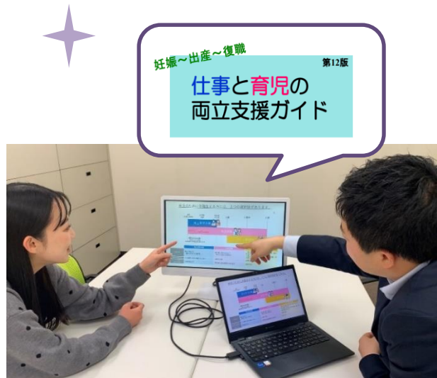
きめ細やかでわかりやすいガイドブック