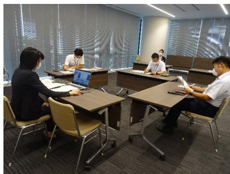
「プレパパミーティング」の様子