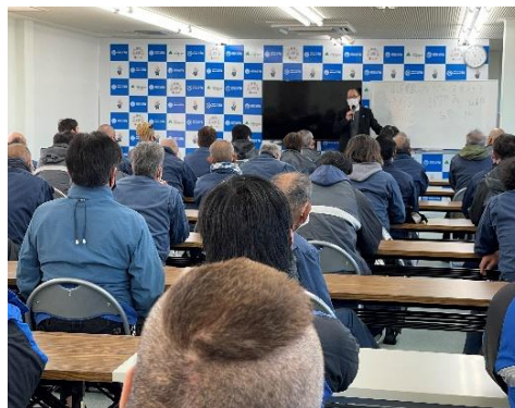
ハラスメント講習会の様子