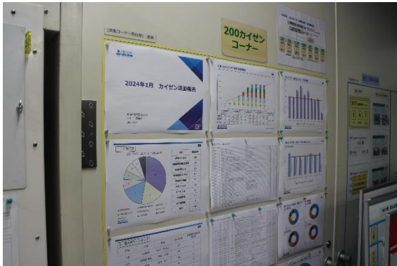
改善の好事例を掲示し褒め合う「200いいね運動」