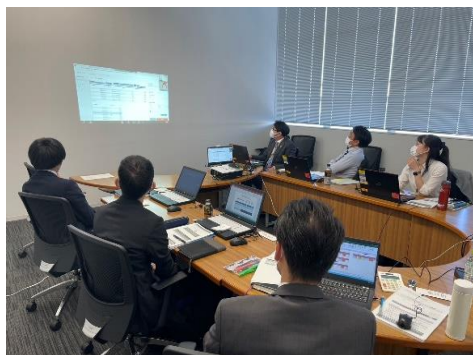
社内DX化研修の様子