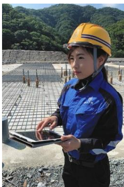
女性現場監督も活躍