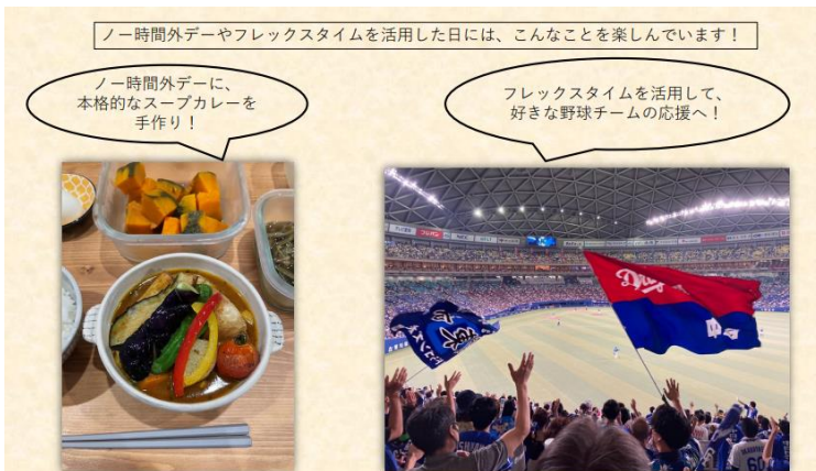
働き方改革で得られた時間の使い方を社内報で共有