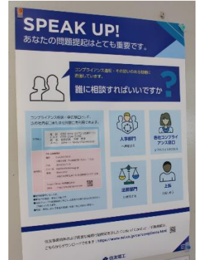
社外を含む相談窓口