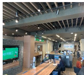
フリーアドレスのオフィス 効率改善のアイデアと 遊び心が詰まっている