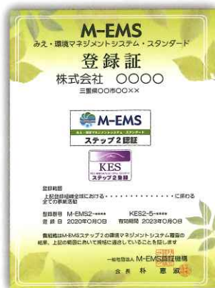
※登録証のサンプルです。

NPO法人KES環境機構(KES)と相互認証しています。M-EMS認証登録することで、KES認証も同時に取得となります。