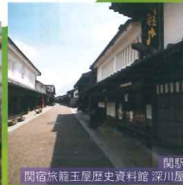
関駅 関宿旅籠玉屋歴史資料館 深川屋