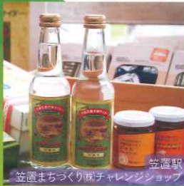
笠置駅 笠置まちづくり林チャレンジショップ