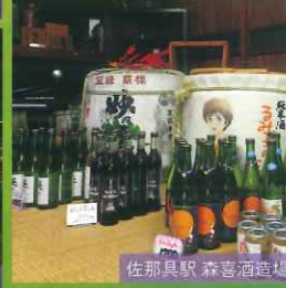
佐那具駅 森喜酒造場