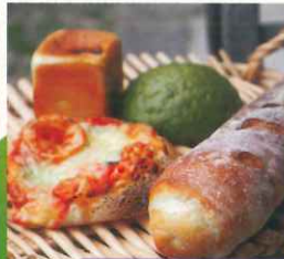
大河原駅 ミッシーのパン