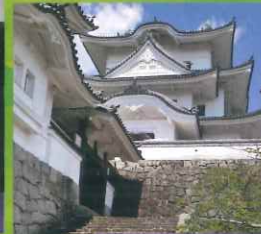
伊賀上野駅 伊賀上野城