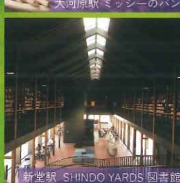
新堂駅 SHINDO YARDS 図書館 BOOKMARK STORAGE