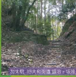
加太駅 旧大和街道 鍛冶ヶ坂峠