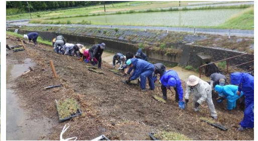
ノシバの定植作業