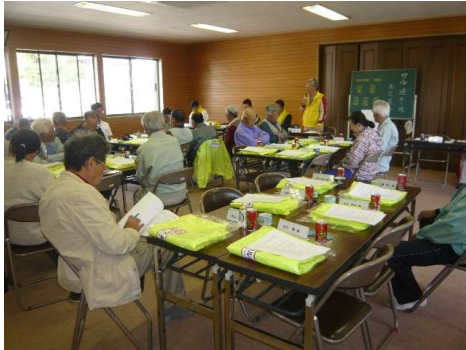
サル追出し隊発足集会