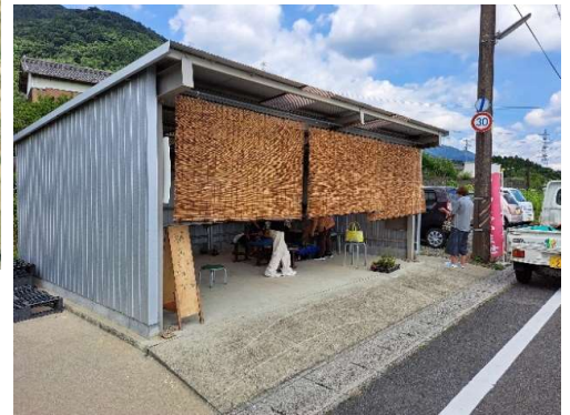
毎週日曜日開催の朝市