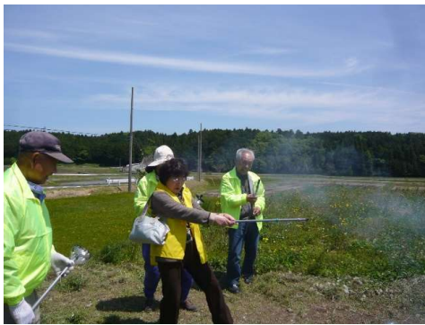
サル追出し隊パトロール