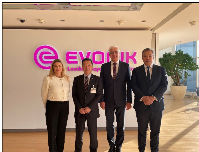
10月23日エボニック社訪問