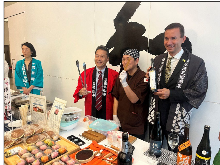
10月22日全国知事会 共同観光プロモーション