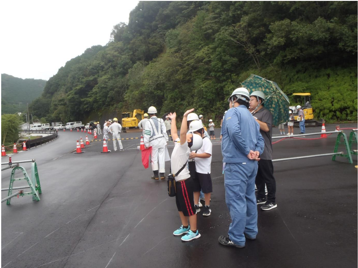
4) 【路盤に思い思いの絵を書いてもらう】