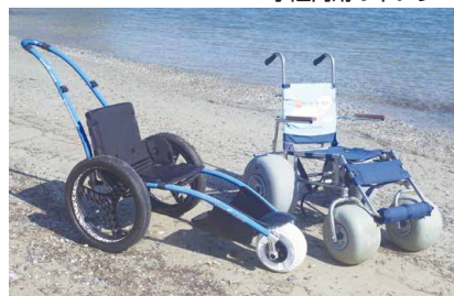
水陸両用の車いす

車いすを始め、ベビーカー・水陸両用の車いす・シャワーチェア・シャワーキャリー・JINRIKI(ジンリキ)などの貸し出しを行っています(一部有料)。また、電動ベッド(介護ベッド)などの福祉機器は、レンタル対応可能な事業所をご紹介します。