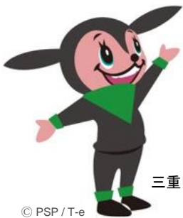
三重県応援キャラクター 兎の助