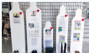
生命のメッセージ展in三重