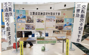
三重県交通遺児を励ます会