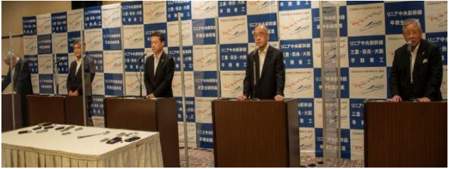
令和4年度 三重・奈良・大阪リニア中央新幹線建設促進大会(R4.9)