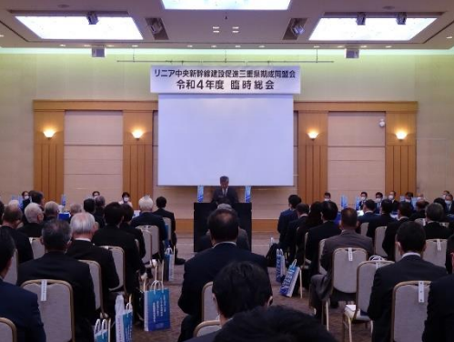
リニア三重県期成同盟会臨時総会(R4.11.4)