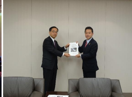
JR東海社長への要望書手交(R4.11.18)