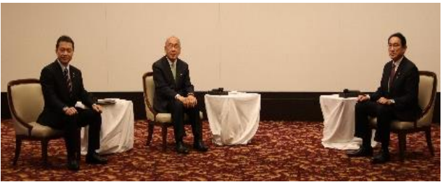
岸田内閣総理大臣・奈良県知事との意見交換(R4.6)