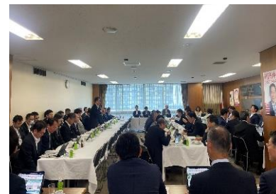
自民党超電導リニア鉄道に関する特別委員会(R6.6.7)