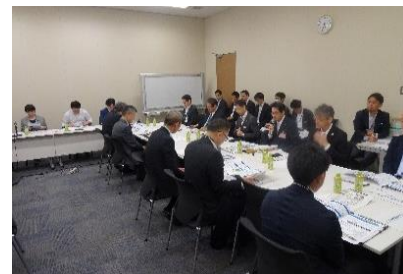
大阪-名古屋-東京間リニア中央新幹線早期実現を目指す議員連盟総会(R6.6.6)