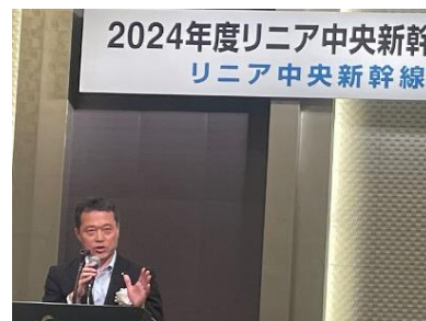
リニア全国同盟会総会(R6.6.7)