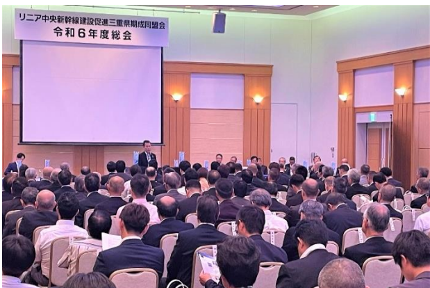
リニア三重県同盟会総会(R6.7.1)