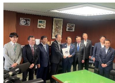
齊藤国土交通大臣への要望活動(R6.6.7)