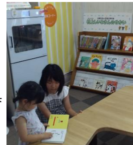
読書コーナーで絵本を読む子どもたち 三重県立みえこどもの城

松阪市にある「みえこどもの城」でも、来館する親子に向けて、読書コーナーを設置しています。楽しい子ども向けの本をはじめ、県内の児童文学作家の本を集めた本棚や高校生が製作した机が子どもたちを出迎えます。読書コーナーにはいつも子どもたちでいっぱいです。