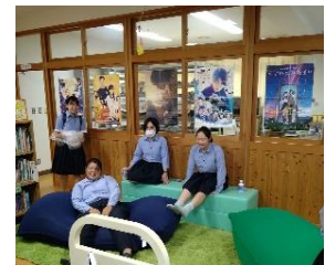
リニューアルされた図書館を楽しむ生徒 鳥羽高等学校図書館

モデル校からは、「生徒が図書館を知る機会となり、来館者が増えた」「地域の団体やPTAと連携することで、本の貸し借りだけでなく、新たな取組が生まれた」などの成果が報告されています。