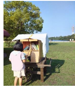
森のライブラリーで絵本を楽しむ親子 県立鈴鹿青少年センター（イメージ）

デザインから設計、製作までを高校生が行い、県にゆかりのある絵本作家の作品を中心に配架し、県立鈴鹿青少年センターへ配備しました。青空のもと、緑に囲まれてワクワク・ドキドキしながら読書ができる環境ができました！