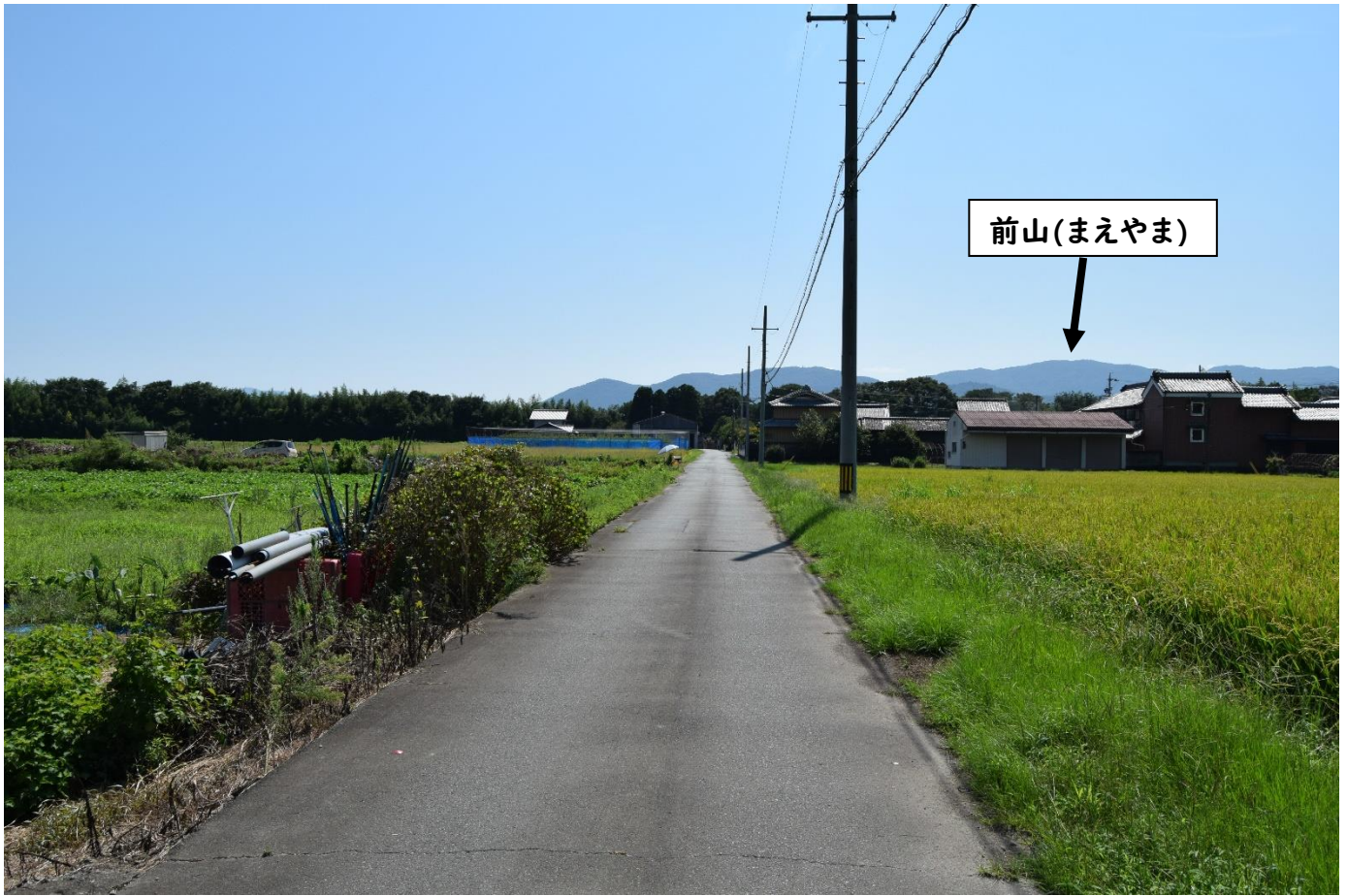
写真② 調査範囲から東側に伊勢市内の山々を臨む