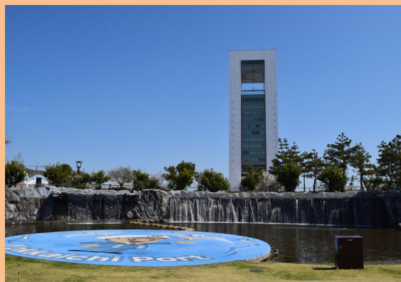
四日市霞港公園(ポートビル)