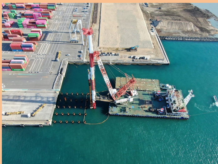
四日市港霞ヶ浦北ふ頭地区岸壁