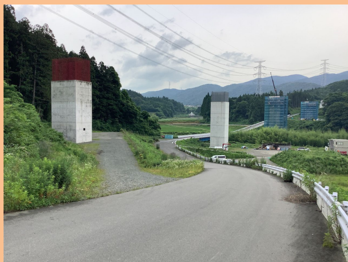
東海環状自動車道(田切川橋)

お問合せ 三重県 県土整備部 技術管理課「土木の日」市民見学会事務局 電話 059-224-2918 Fax 059-224-3290 電子メール gijyutsu@pref.mie.jp