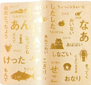
〈三重シンボル〉アイボリー

販売価格 1,200 円(税込) 主な仕様 カバー:塩ピカパー(リサイクル素材) サイズ:幅94mm×高173mm×厚13mm 本文:272ページ リボン紐:2本