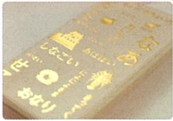
華やかなゴールドの箔押し加工

三重県の方言は大きく北勢、中勢、南勢志摩、東紀州、伊賀に分かれています。 (行政の地方区分とは少し違います) 地区それぞれの多彩な方言を掲載し、県民の皆様にワイワイと地元言葉について話して楽しんでいただけたら幸いです。