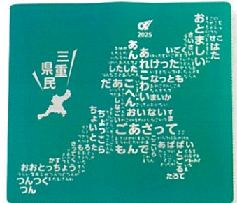
〈三重マップ〉グリーン