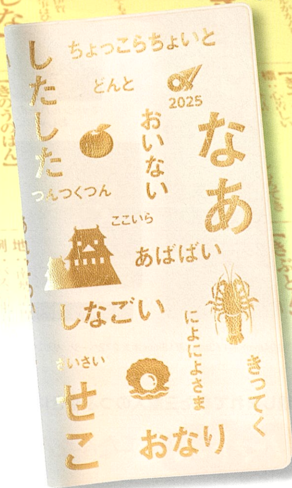
〈三重シンボル〉アイボリー