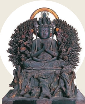
木造千手観音坐像 (王寺町指定文化財)