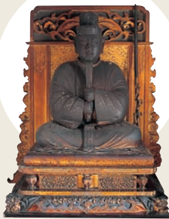
木造聖徳太子坐像