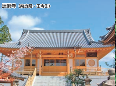
達磨寺(奈良県・王寺町)