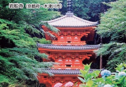
岩船寺(京都府・木津川市)