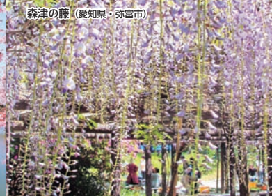
森津の藤(愛知県・弥富市)