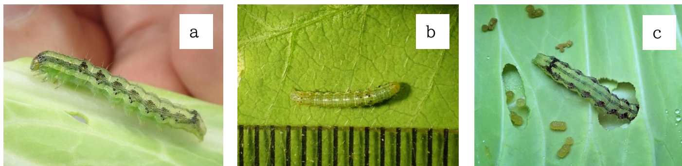
図2 a・bオオタバコガ幼虫 cキャベツに食入する幼虫 体の色や刺毛(トゲ)の基部の色には変異がありますが、刺毛や体節は比較的顕著です。