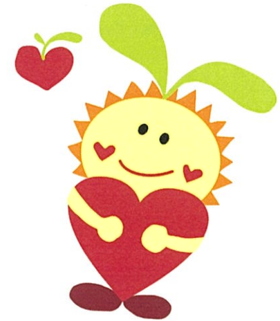
みえさとちゃん (三重県里親啓発公認キャラクター)

様々な事情で自分の家庭で暮らせない子どもたちを家庭に迎え入れ、養育を行う方を「里親」といいます。