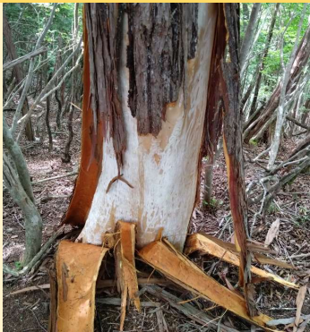
クマが木の皮を剥いだ跡