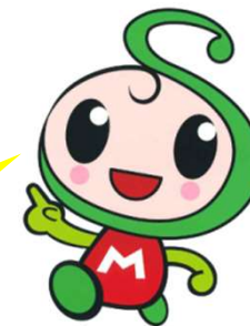
「せいえいみえちゃん」

生衛法に基づいて設立された生衛組合は、組合員・業界のためだけでなく、利用者・消費者、地域社会、地域経済、行政に貢献する組織です。