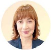
三重工熱株式会社 代表取締役社長