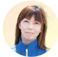
アース・クリエイト有限会社 執行役員総務部長

高校卒業後、大手電機メーカーへ入社。平成6年父親が経営する三重工熱へパート社員として入社。物作りの大切さを感じつつ、営業活動で様々な人と関わり、やりがいを見いだす。社長であった父が大病を患い、自分の立ち位置を改めて見つめる。人生の中で自分が社長になるとは全くの想定外だったが、平成23年社長のバトンを受け取る。