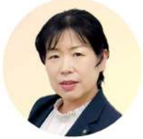
株式会社赤福名古屋営業所 所長

アースグループが運営する児童福祉でパートとして入社。正社員での就職を目指し、アース・クリエイト(有)に正社員として入社。育児休業中に保育士試験にチャレンジし、復職後、保育士試験合格。育児休業中のママさん中心の部署を設立し、企画制作室マネージャーに就任。その後、執行役員総務部長に就任。